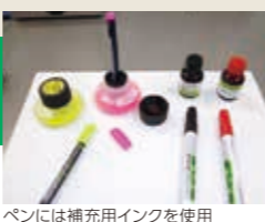
ペンには補充用インクを使用

また、作業車両に低公害車であるLPガスフォークリフトを使用し、銀行や本社への移動には自転車を使用するなど、CO 2 削減にも取り組んでおります。