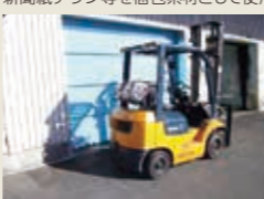
LPガスフォークリフト