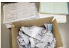
新聞紙チラシ等を梱包素材として使用