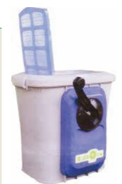
処理機の名前は「生ゴミ0(ゼロ)くん」です。5年前に導入しました。

コピー紙は裏紙を使用し、排出する紙類は全てリサイクルに回しています。 また、MELONの特長的な取組として、茶殻その他の生ごみ処理について紹介します。 MELONには毎日お客様がたくさんおいでになりますが、お茶をお出しすると茶殻がでます。これを昼食の食べ残しや果物の皮などと一緒に事務所の中で「手動式生ごみ処理機」に投入して分解しています。 生ごみが出たら投入して手でハンドルをクルクルと回すだけです。電気も使わないし、臭いも出ないので重宝しています。生ごみの減量化により、燃えるごみの袋の排出回数は10日に1回程度です。料理教室やエコ芋煮会で出た野菜屑の分解にも活躍しています。