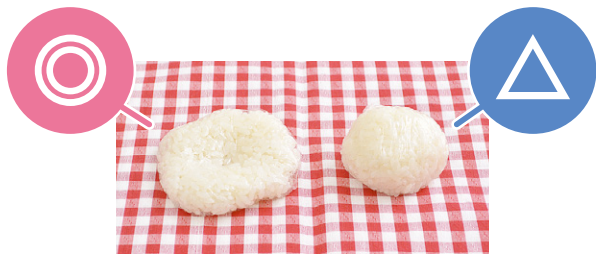
冷凍ごはんの保存期間は約1カ月。解凍後はその日のうちに食べましょう