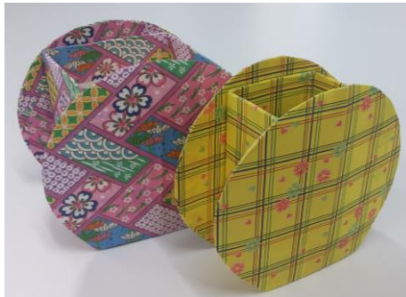
～まるまるペン立て～